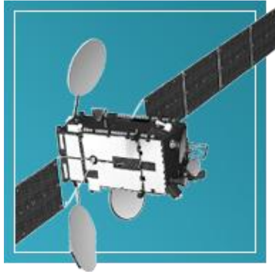
Автоматические космические системы