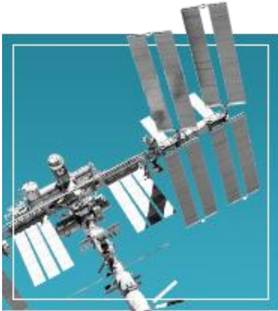
Пилотируемые космические системы